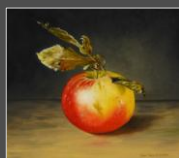
Appel (20 x 20 cm)