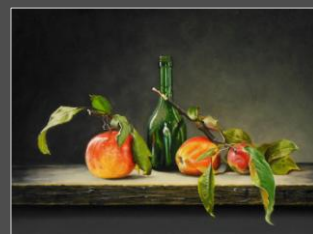
Stillevan met appeltak en fles (30 x 40 cm)