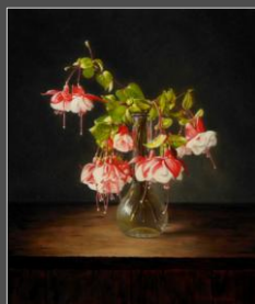
Fuchsia's (36 x 30 cm)