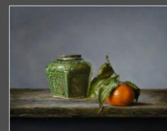
Stillevan met gemberpot en mandarijn (24 x 30 cm)