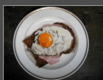
Uitsmijter (diameter bordje 20 cm)