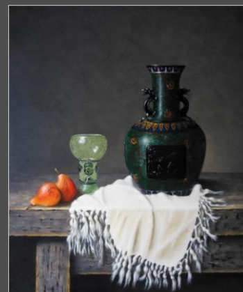
Stillevan met Cloisonné vaas (55 x 45 cm)