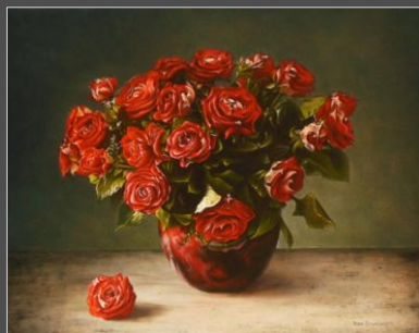
Rode rozen (40 x 50 cm)